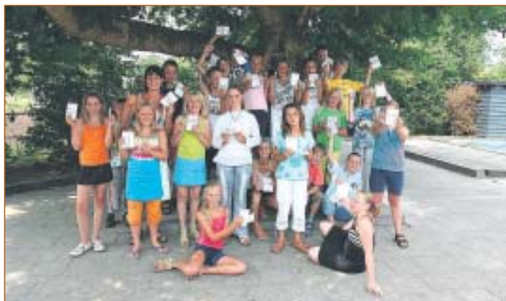
De leerlingen van De Finne zijn blij met de beoordeling van hun pagina. Op 6 september gingen ze op excursie naar Hazewinkel Pers in Groningen.

Scholieren zijn de lezers van de toekomst. Daarom wilde de jubileumredactie deze groep ook bij de festiviteiten rond het 75-jarige jubileum betrekken. Op deze manier wilde ze er achter komen waar de jeugd zich zoal voor interesseert. Aan 41 basisscholen in het verspreidingsgebied van de krant werd gevraagd om een pagina te maken met het nieuws dat hen bezig houdt. Christelijke basisschool De Finne uit Jistrum werd daarbij als mooiste van de dertien deelnemende scholen beoordeeld. De leerlingen zijn echt creatief met hun fantasie aan de slag gegaan, aldus de jury. De winnende klas ging op excursie naar de drukkerij in Groningen waar De Feanster wordt gedrukt.