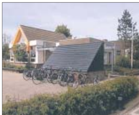
Basisschool "de Finne"

Na onze speurtocht zijn we weer in de tijdmachine gestapt en weer teruggegaan naar de tijd van nu.